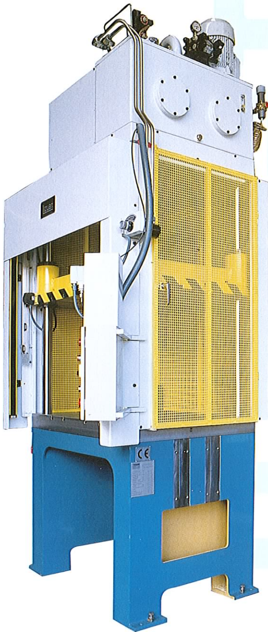
Prensas hidráulicas de cuello de cisne y de cuatro columnas.